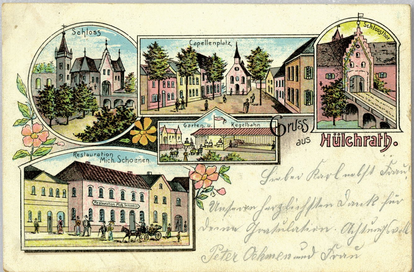
Gruß aus Hülchrath von ca. 1910