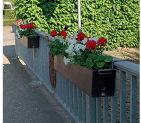
Bepflanzte „Blumenkübel / Blumenkästen“ 2022

Blumenkästen im Dorf. Die Kosten für die Bepflanzung 2022 belaufen sich aktuell auf 350,- Euro.